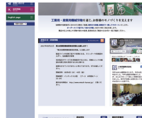
【実績サイト】 三有研器㈱ https://sanyukenki.com/ Facebook ページと連携させています

ウェブページはコードでできていますが、CMSの導入により、内部構造を意識することなく だれでもすぐに新着情報等を追加更新できます 。編集可能部分とそうでないところを分けることで、不意なデザインの崩壊も起こりません。