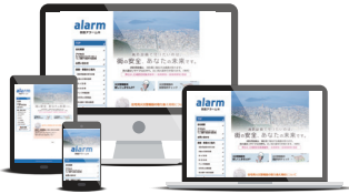
【実績サイト】 四国アラーム㈩ http://shikoku-alarm.com/

PC、タブレット、スマートフォン、印刷結果など、デバイスによってサイトの利用に支障が生じないように、HTMLやCSSなどの標準規格に準拠し設計します。単一ページでの構築により、情報更新等のメンテナンスが極めて容易です。