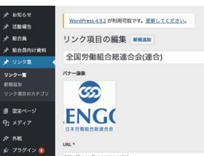
【実績サイト】 中国労働金庫労働組合 https://chugoku-runion.jp/ 画像はスタッフ用更新システムです