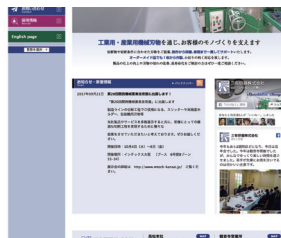
【実績サイト】 三有研器㈩ https://sanyukenki.com/ Facebook ページと連携させています

インターネット上には、前述のSNS、カレンダーサービスほか優秀なサービスがたくさん動いています。それらと連携することにより、早く安くサイトを構築するだけでなく、新たにリリースされるサービスと連携するなど、サイトの将来性もアップします。