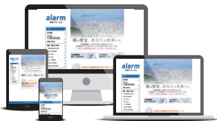
【実績サイト】 四国アラーム㈩ http://shikoku-alarm.com/

PC、タブレット、スマートフォン、印刷結果など、デバイスによってサイトの利用に支障が生じないように、HTMLやCSSなどの標準規格に準拠し設計します。単一ページでの構築により、情報更新等のメンテナンスが極めて容易です。