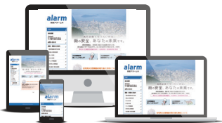
【実績サイト】 四国アラーム㈩ http://shikoku-alarm.com/

PC、タブレット、スマートフォン、印刷結果など、 デバイスによってサイトの利用に支障が生じないよう、HTMLやCSSなどの標準規格に準拠し設計します。 単一ページでの構築により、情報更新等のメンテナンスが極めて容易です。